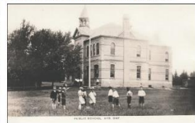
Ayr Public School.